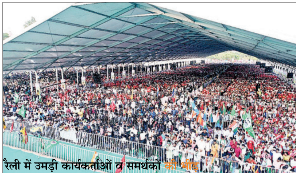
रैली में उमड़ी कार्यकर्ताओं व समर्थकों की भीड़