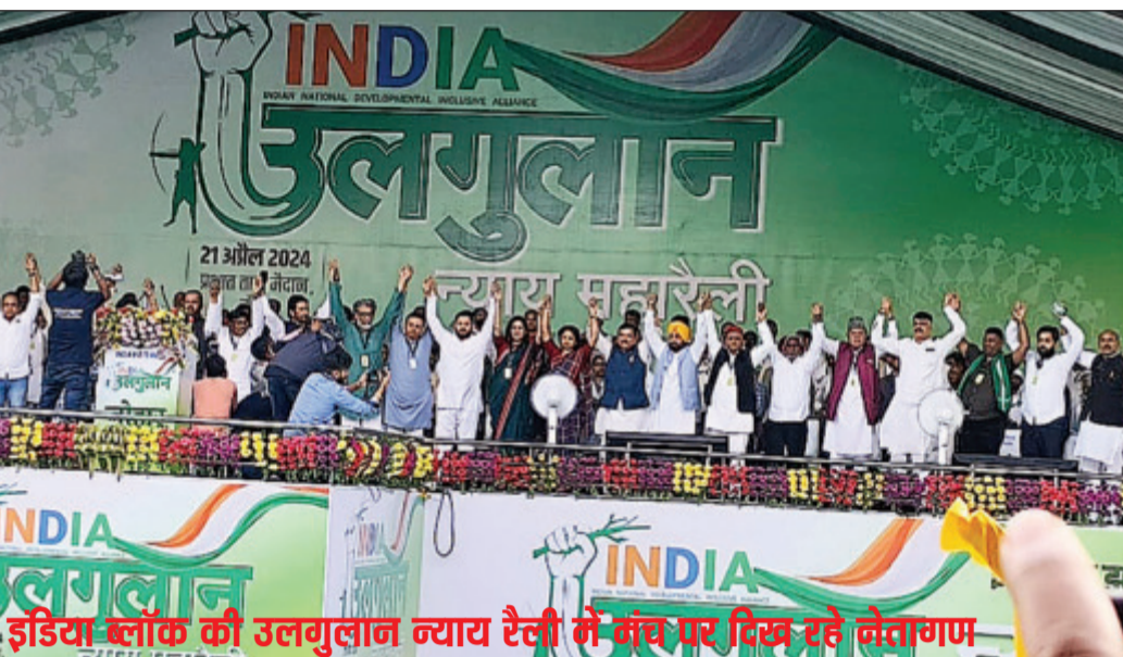
इंडिया ब्लॉक की उलगुलान न्याय रैली में मंच पर दिख रहे नेतागण