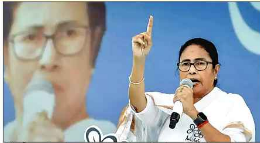
مغربی بنگال کی وزیر اعلیٰ ممتا بنرجی نے ہفتہ کے روز اپوزیشن بھارتیہ جنتا پارٹی (بی جے پی) پر مشرقی مدنی پور ضلع میں دہشت گردانہ کارروائیوں کا اظہارِ افسوس کیا۔

جس میں بی بی کیئر سینٹر کے مالکوں کی موت ہوئی اور اس کا بیٹا شدید زخمی ہو گیا تھا۔ خاتون کا بیٹا علاقے میں بی بی کیئر سینٹر کے مالکوں کی موت پر گہرے دکھ کا اظہار کیا ہے۔