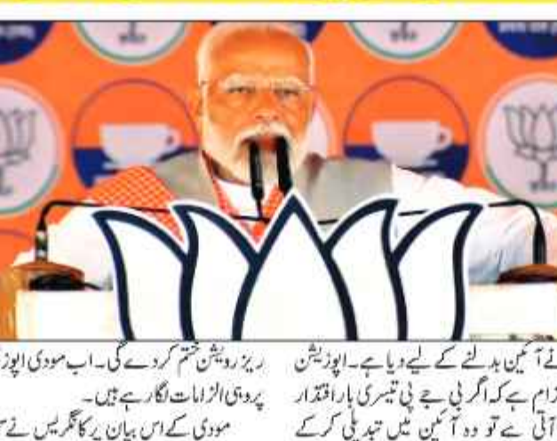
وزیر اعظم نریندر مودی نے ہفتہ کے روز ہاتھ لے پتر میں اپوزیشن پر سخت حملہ کرتے ہوئے کہا کہ انڈیا اتحاد ووٹ کے لئے اپنے ووٹ بینک کے سامنے 'مجرے' کر سکتا ہے۔