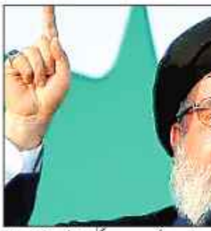
حزب اللہ کے چیف کا بیان کہ اسرائیل کو حیران کن حملوں کی دھمکی ہے۔

نئی دہلی 26 مئی (پرائیوٹی) حزب اللہ کے چیف کا بیان کہ اسرائیل کو حیران کن حملوں کی دھمکی ہے۔