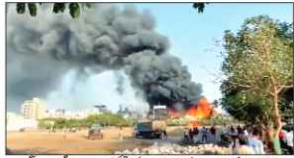
گجرات کے راجکوٹ شہر میں ہفتہ کی شام ایک خوفناک حادثہ ہوا جس میں کم از کم دو درجن افراد ہلاک ہو گئے ہیں۔

گجرات 26 مئی (پرائیوٹی) گجرات کے راجکوٹ شہر میں ہفتہ کی شام ایک خوفناک حادثہ ہوا جس میں کم از کم دو درجن افراد ہلاک ہو گئے ہیں۔