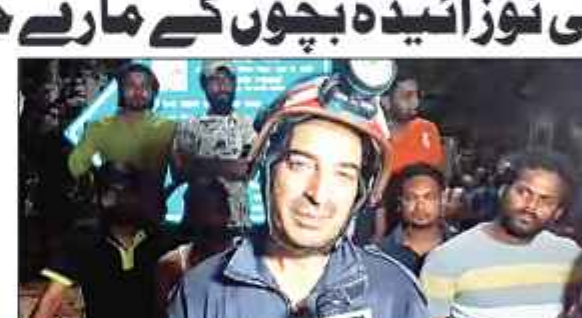
دہلی کے ایک دوپہار میں واقع بی بی کیئر سینٹر میں آگ لگنے سے چھوٹے بچوں کی موت ہو گئی ہے۔

دہلی 26 مئی (پرائیوٹی) دہلی کے ایک دوپہار میں واقع بی بی کیئر سینٹر میں آگ لگنے سے چھوٹے بچوں کی موت ہو گئی ہے۔