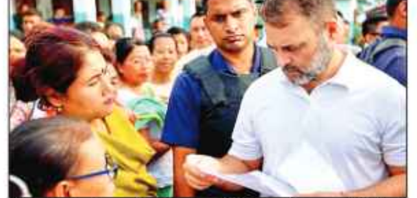
نی دہلی، 11 جولائی (پوائن آئی) کانگریس کے سابق صدر اور لوک سبھا میں اپوزیشن لیڈر راہل گاندھی نے کہا کہ سسر مودی کو خود دہاں جانا چاہئے اور لوگوں سے امن کی اپیل کرنی چاہئے تاکہ حالات معمول پر آسکیں۔ انہوں نے کہا، ”ممنی پور میں تشدد شروع ہونے کے بعد میں تیسری بار بیان آیا ہوں لیکن بد قسمتی سے حالات میں کوئی بہتری نہیں آئی ہے۔ آج بھی ریاست دہلی میں تشدد عین ہوئی ہے۔ گھر جل رہے ہیں، مصوم جانیں خطرے میں ہیں اور ہزاروں بچے ریڈ کراس کیمپوں میں رہنے پر مجبور ہیں۔“

انہوں نے کہا کہ وہاں حالات معمول پر نہیں آ رہے ہیں۔ سسر مودی کو خود دہاں جانا چاہئے اور لوگوں سے امن کی اپیل کرنی چاہئے تاکہ حالات معمول پر آسکیں۔ انہوں نے کہا، ”ممنی پور میں تشدد شروع ہونے کے بعد میں تیسری بار بیان آیا ہوں لیکن بد قسمتی سے حالات میں کوئی بہتری نہیں آئی ہے۔ آج بھی ریاست دہلی میں تشدد عین ہوئی ہے۔ گھر جل رہے ہیں، مصوم جانیں خطرے میں ہیں اور ہزاروں بچے ریڈ کراس کیمپوں میں رہنے پر مجبور ہیں۔“