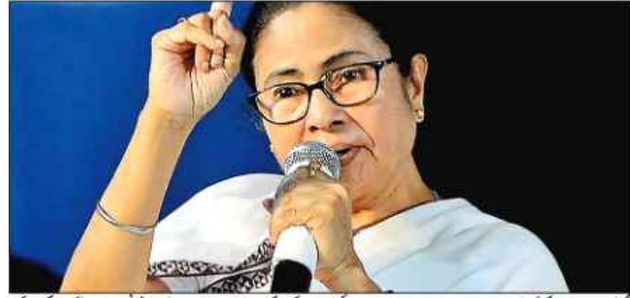
ممبئی پارٹی ہوں کیونکہ آپ سب جانتے ہو رہی ہے۔ وہ بھی بارہو کر چکے ہیں اور وائٹ بلیک کانفرنس میں شرکت کر چکے ہیں۔ میں شادی نہ جاتا لیکن شیلسٹ بی، ان

کولکتہ 11 جولائی (تمنا) مغربی بنگال کی وزیر اعلیٰ من بنرجی نے کہا کہ وہ شیوینا (پولی ٹی) کے سربراہ ادھوٹھا کرے اور شیلسٹ کانگریس پارٹی (این سی بی-ایس بی) کے سربراہ شرد پوار سے جو کوئی بھی ملاقات کریں گی تاکہ ملک کی موجودہ سیاسی صورتحال پر تبادلہ خیال کیا جاسکے۔ شیلسٹ اسپانی کے بی بی سی شادی میں شرکت کے لیے بھی روانگی سے قبل بھارت کو نامہ نگاروں سے بات کرتے ہوئے بنرجی نے کہا کہ وہ سناج وادی پارٹی کے سربراہ اکھلیش یادو سے بھی ملاقات کریں گی۔ اس نے کہا، میں