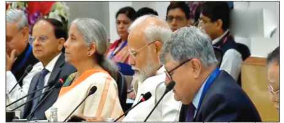
نی دہلی 11 جولائی (پوائن آئی) پیش کیے جانے والے مرکزی بجٹ سے قبل ماہرین اقتصادیات کے ساتھ خزانہ نماز پٹیل نے بھی موجود تھے۔

ماہرین اور اقتصادیات میں سرچیت بھلا، اس کے چھاپا چاپا پروفیسر شوک گلائی، گورنر بلدیہ ایچا ہندو اور پوار کے وئی کا سہمہ شامل تھے۔ مرکزی وزیر خزانہ نماز پٹیل نے 23 جولائی کو لوک سبھا میں 2024-25 کا بجٹ پیش کرنے کا رسی ہیں۔ اقتصادی ماہرین اور علاقائی ماہرین کے علاوہ نیٹی آؤگ کے دانش چتر سمن کی بی بی سی اور گورہا میں بھی وزیر اعظم کی میٹنگ میں شرکت کی ہے۔ مودی 0.3 حکومت کی جینی بڑی اقتصادی دستاویز ہوگی۔