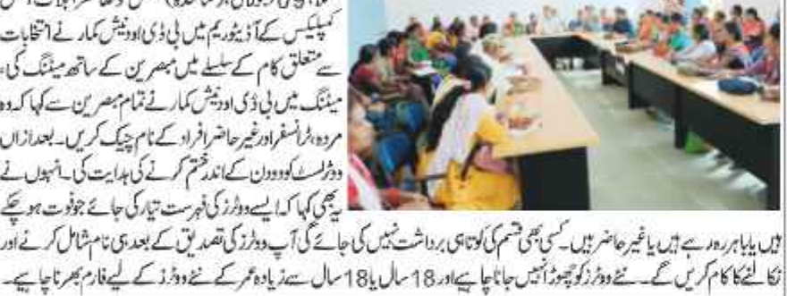
کلا، 09 جولائی، (نمائندہ)۔ منگل کو گھارہ بلاک آفس کانگریس کے ذریعہ بی بی اوز پیش کردہ انتخابات سے متعلق کام کے سلسلے میں بھسورین کے ساتھ میٹنگ کی، منریگا میں بی بی اوز پیش کردہ تمام سرین سے لگا کر وہ مراد پراسرار اور جھارکھنڈ کے نام چیک کریں۔ بعد ازاں ڈپٹی کمشنر کے اندر ختم کرنے کی ہدایت کی۔ انہوں نے بی بی او کے بارے میں ہدایت دی۔ بی بی او کے بارے میں ہدایت دی۔ بی بی او کے بارے میں ہدایت دی۔ بی بی او کے بارے میں ہدایت دی۔