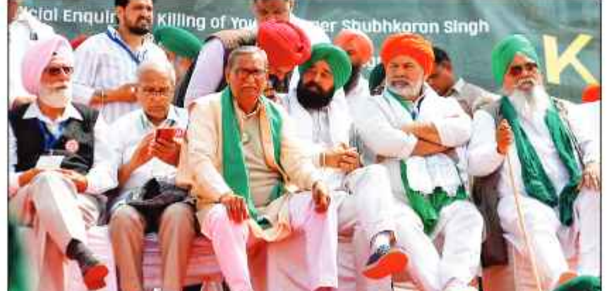
تین قومی سے متعلق بھی بات کی، جس کے بارے میں کسان لیڈروں کا کہنا ہے کہ حکومت ان قوانین کے ساتھ آمرانہ موقف اختیار کرنا چاہتی ہے۔ سٹیوٹ کسان مورچہ نے ملے کیا ہے کہ وہ کسانوں کے مفاد کے

نی دہلی 11 جولائی (پوائن آئی) ایک کسان ایک بار پھر حکومت کے خلاف محاذ کھولنے کی تیاری کر رہے ہیں۔ حکومت کے خلاف احتجاج کا یہ فیصلہ سٹیوٹ کسان مورچہ کی میٹنگ میں کیا گیا ہے، جس میں 17 ریاستوں سے کسانوں کے 150 نمائندے شریک ہوئے۔ اس میٹنگ میں ایم ایس بی، کسانوں کو بھینٹن سمیت کسانوں سے متعلق دیگر مسائل پر حکومت کے خلاف ایک بڑے احتجاج کا فیصلہ کیا گیا ہے۔ اس میٹنگ میں کسان لیڈروں نے حکومت کے