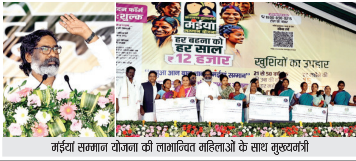
मंडियां सम्मान योजना की लाभान्वित महिलाओं के साथ मुख्यमंत्री

मुख्यमंत्री हेमन्त सोरेन ने रविवार को गायबधान महेशपुर, पाकुड़ में आयोजित 'झारखंड मुख्यमंत्री मंडियां सम्मान योजना (जेएमएमएसवाई)' के शुभारंभ कार्यक्रम को संबोधित करते हुए यह बात कही। इस अवसर पर मुख्यमंत्री ने राज्य की सभी बहन-बेटियों को रक्षाबंधन त्यौहार की हार्दिक बधाई दी। मुख्यमंत्री ने कहा कि रक्षाबंधन त्यौहार पूरे देश में उत्साह, उमंग और श्रद्धा के साथ