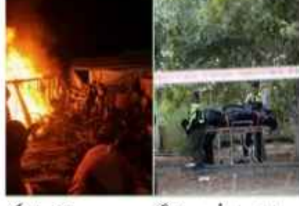
لبنان: لبنانی ایران نواز گروپ حزب اللہ نے آج اتوار کی صبح شمالی اسرائیل پر درجنوں کیموشن راکٹوں سے حملہ کر دیا۔ حزب اللہ کا کہنا ہے کہ اس نے حملہ جنوبی لبنان میں شہریوں کو نشانہ بنانے کے جواب میں کیا ہے۔ لبنان کی وزارت صحت نے لبنان کی سرحد پر واقع قصبہ دیر سریان میں اسرائیلی فوج کے نشانے چلنے میں ہلاکتوں کے حوالے سے ایک بیان جاری کیا ہے۔

کہا گیا ہے کہ ایک 17 سالہ لڑکی جاں بحق اور 16 افراد زخمی ہوئے ہیں۔ دوسری جانب اسرائیلی فوج نے دعویٰ کیا ہے کہ اس نے حزب اللہ کی طرف سے داغے گئے زیادہ تر راکٹوں کو مار گرایا ہے۔ حزب اللہ نے ایک بیان میں کہا ہے کہ جنوبی دیہاتوں پر اسرائیلی فوج کے حملوں، خاص طور پر کفر بیکلا اور دیر سریان کے دیہاتوں کو نشانہ بنانے اور شہریوں کے زخمی ہونے کے جواب میں اس نے ایک نئے علاقے "ہیت بلبل" پر میزائلوں سے بمباری کی ہے۔ ایک اندازے کے مطابق جنوبی لبنان سے شمالی اسرائیل کی طرف تقریباً 50 راکٹ داغے گئے۔ دوسری جانب جبروت میں امریکی سفارت خانے نے اپنے شہریوں کو سکیورٹی وارننگ جاری کر دی ہے اور کہا ہے کہ لبنان چھوڑنے والوں کی حوصلہ افزائی کرتے ہیں، وگرنہ بھی دستیاب شدہ خریدیں اور ان کی مطلوبیات پر ہوں یا نہیں۔