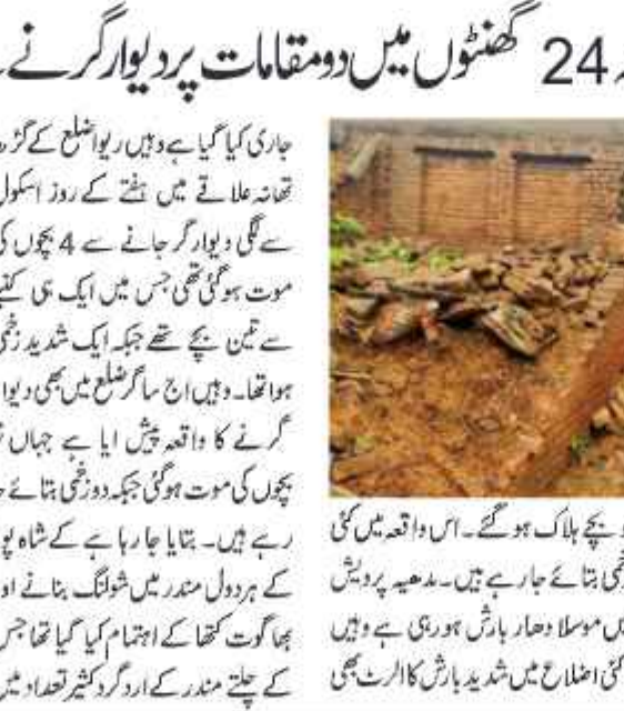
مدھیہ پردیش میں گزشتہ 24 گھنٹوں میں دو مقامات پر دیوار گرنے سے 17 بچوں کی موت ہوئی۔ ایس ایچ کے ایک ویڈیو پوسٹ کیا ہے، جس میں انہوں نے مودی حکومت کو نشانہ بنایا ہے۔ اس میں اویسی نے کہا کہ جب پارلیمنٹ کا اجلاس ہوا ہے تو مرکزی حکومت پارلیمانی بلادتی اور مراعات کے خلاف کام کر رہی ہے اور میڈیا کو مطلع کر رہی ہے، لیکن پارلیمنٹ کو نہیں بتا رہی ہے۔