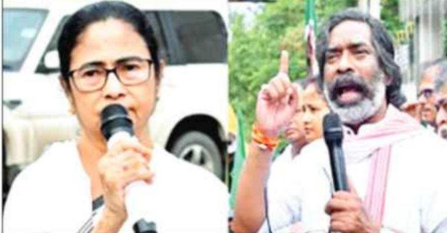
سیلاب کی صورتحال کی خبریں سن کر ہیمانت سورین نے وزیر اعلیٰ ممتا بنرجی سے بات کی اور ان کے ساتھ ساتھ شمال بنگال کے تمام

مغربی بنگال کی وزیر اعلیٰ ممتا بنرجی نے اتوار کو جھارکھنڈ کے وزیر اعلیٰ ہیمانت سورین سے ٹیلی فون پر ٹینوگھاٹ ڈیم سے پانی چھوڑنے کی وجہ سے بنگال میں سیلاب کی صورتحال پر بات کی