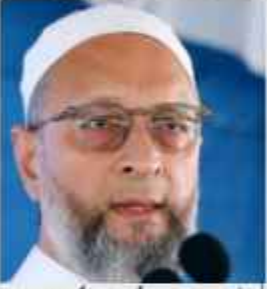
اسلمین (اے آئی ایم آئی ایم) کے سربراہ اسد الدین اویسی نے اتوار کے روزنامہ ایس ڈی کے وقت بورڈ کے حقوق کو کم کرنے کے لئے ایک بل لانے کے مرکز کے منصوبہ پر رد عمل ظاہر کیا ہے۔ ایم آئی ایم نے سوشل میڈیا پلٹ فارم ایس ایچ کے ایک ویڈیو پوسٹ کیا ہے، جس میں انہوں نے مودی حکومت کو نشانہ بنایا ہے۔ اس میں اویسی نے کہا کہ جب پارلیمنٹ کا اجلاس ہوا ہے تو مرکزی حکومت پارلیمانی بلادتی اور مراعات کے خلاف کام کر رہی ہے اور میڈیا کو مطلع کر رہی ہے، لیکن پارلیمنٹ کو نہیں بتا رہی ہے۔ میں کہتا ہوں کہ اس مجوزہ ترمیم کے بارے میں میڈیا میں جو جھگڑا ہو رہا ہے اس سے ظاہر ہوتا ہے کہ مودی حکومت وقف بورڈ کی خود مختاری چھیننا چاہتی ہے اور اس میں مداخلت کرنا چاہتی ہے۔ یہ بذات خود مذہبی آزادی کے خلاف ہے۔ اویسی نے کہا کہ دوسری بات یہ ہے کہ پی جے پی شروع سے ہی ان بورڈوں اور وقف الماک کے خلاف رہی ہے اور یہ ان کا ہندو تووالیجنڈا ہے۔ اب اگر آپ وقف بورڈ کے قیام اور ڈھانچے میں ترمیم کریں گے تو وہاں انتخابی اثرات فری پیدا ہو جائے گی، اس کی خود مختاری ختم ہو جائے گی۔ وقف بورڈ ختم ہو جائے گا اور اگر وقف بورڈ پر حکومت کا کنٹرول رہتا ہے تو وقف کی آزادی متاثر ہوگی۔ اس میں اویسی نے کہا کہ جب پارلیمنٹ کا اجلاس ہوا رہا ہے تو مرکزی حکومت پارلیمانی بلادتی اور مراعات کے خلاف کام کر رہی ہے اور میڈیا کو مطلع کر رہی ہے، لیکن پارلیمنٹ کو نہیں بتا رہی ہے۔

وقف ایکٹ میں ترمیم کے منصوبہ کو ایسی نے قرار دیا ہے پی کا ہندو تووالیجنڈا نئی دہلی: آل انڈیا مجلس اتحاد