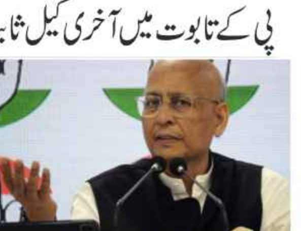
لوک سبھا میں قائد حزب اختلاف رائل کا دعویٰ ہے کہ بی بی جے پی کے قتل کے معاملے کو لے کر حزب اختلاف کی تمام سیاسی پارٹیاں ایک آواز میں مرکزی حکومت پر حملہ کر رہی ہے۔ عام آدمی پارٹی کی جانب سے کہا گیا کہ رائل کا دعویٰ نے پارلیمنٹ کے اندر حکومت کو بے نقاب کیا اور ای ڈی جے سے ان کے خلاف ای ڈی اور سی بی آئی کا کافی چالاکتی ہے۔ رائل کو گرفتار کرنے کی ضرورت نہیں ہے۔ رائل کو گرفتار کرنے کی ضرورت نہیں ہے۔

بی آئی اور محکمہ انٹرنل سیکورٹی کے قلم کاروں نے بی بی جے پی کے قتل کے معاملے کو لے کر حزب اختلاف کی تمام سیاسی پارٹیاں ایک آواز میں مرکزی حکومت پر حملہ کر رہی ہے۔ عام آدمی پارٹی کی جانب سے کہا گیا کہ رائل کا دعویٰ نے پارلیمنٹ کے اندر حکومت کو بے نقاب کیا اور ای ڈی جے سے ان کے خلاف ای ڈی اور سی بی آئی کا کافی چالاکتی ہے۔ رائل کو گرفتار کرنے کی ضرورت نہیں ہے۔ رائل کو گرفتار کرنے کی ضرورت نہیں ہے۔ رائل کو گرفتار کرنے کی ضرورت نہیں ہے۔