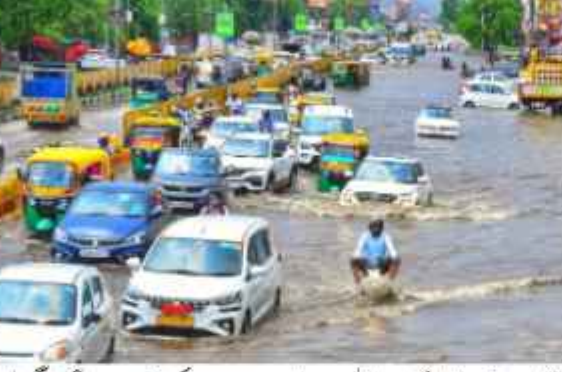
ہماچل پردیش میں ہماچل میں بادل چھنے اور شدید بارشوں کی وجہ سے اور لینڈ سلائیڈنگ کی وجہ سے 114 سڑکیں بند کر دی گئیں ہیں۔ محکمہ موسمیات نے ہفتے کے روز 7 اگست تک ہماچل میں موسلا دھار بارش کی وارننگ جاری کی ہے جس کے بعد احتیاطی تدابیر کے طور پر یہ قدم اٹھایا گیا ہے۔ ریاستی ایمرجنسی آپریشن سینٹر کے مطابق، گاڑیوں کی آمدورفت کے لیے بند سڑکوں میں سے منڈی میں 36 کلومیٹر، 34 شملہ میں 27، لاہول سٹی میں آٹھ گاگڑا میں سات اور کٹر شیل میں دو سڑکیں ہیں۔ ایک