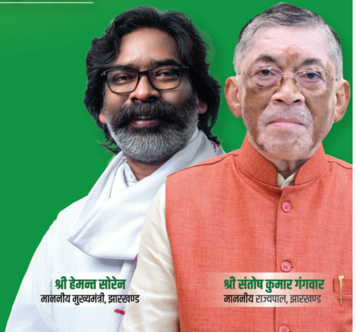
श्री हेमन्त सोरेन माननीय मुख्यमंत्री, झारखण्ड