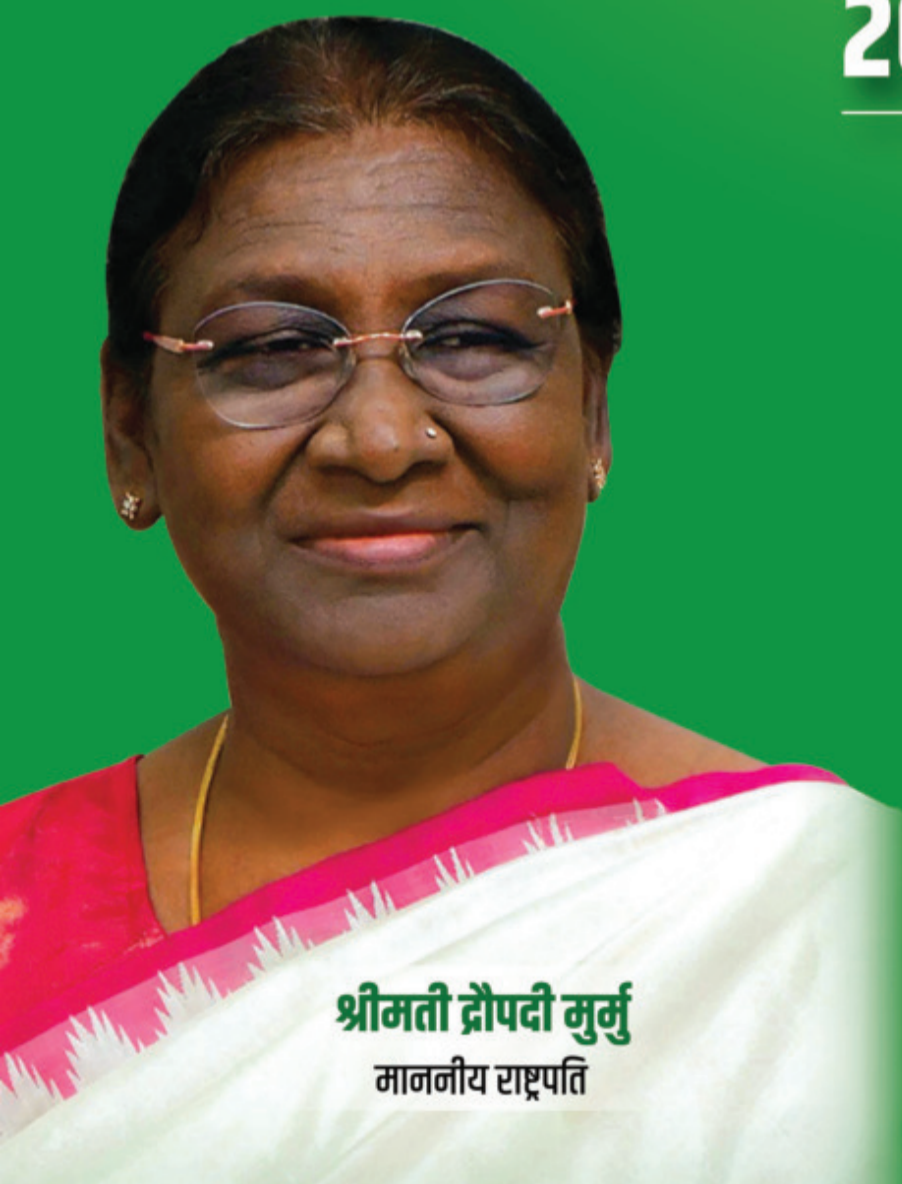
श्रीमती द्रौपदी मुर्मु माननीय राष्ट्रपति