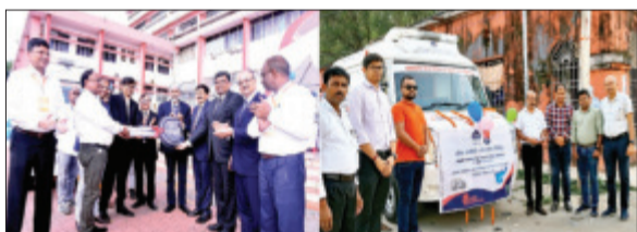
प्रत्यूष नवबिहार संवाददाता