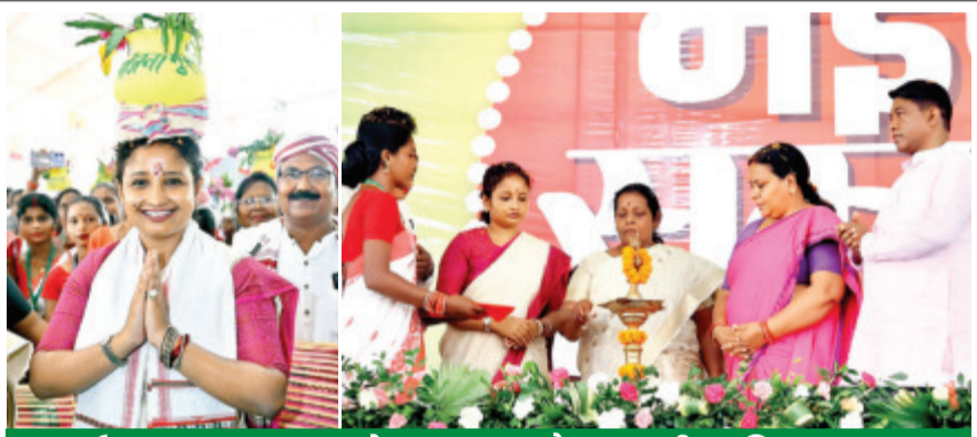
मईयां सम्मान यात्रा के मंच पर मौजूद मंत्री व विधायकगण