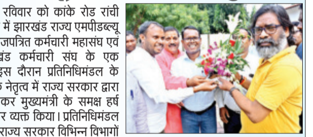
मुख्यमंत्री हेमन्त सोरेन से रविवार को कांके रोड रांची स्थित मुख्यमंत्री आवासीय कार्यालय में झारखंड राज्य एमपीडब्ल्यू कर्मचारी संघ, झारखंड राज्य अराजपत्रित कर्मचारी महासंघ एवं संविदा, अनुबंध, एकमुश्त झारखंड कर्मचारी संघ के एक प्रतिनिधिमंडल ने मुलाकात की।

रांची : मुख्यमंत्री हेमन्त सोरेन से रविवार को कांके रोड रांची स्थित मुख्यमंत्री आवासीय कार्यालय में झारखंड राज्य एमपीडब्ल्यू कर्मचारी संघ, झारखंड राज्य अराजपत्रित कर्मचारी महासंघ एवं संविदा, अनुबंध, एकमुश्त झारखंड कर्मचारी संघ के एक प्रतिनिधिमंडल ने मुलाकात की। इस दौरान प्रतिनिधिमंडल के सदस्यों ने मुख्यमंत्री हेमन्त सोरेन के नेतृत्व में राज्य सरकार द्वारा उनकी मांगों को पूरा करने को लेकर मुख्यमंत्री के समक्ष हर्ष जताया तथा मुख्यमंत्री के प्रति आभार व्यक्त किया। प्रतिनिधिमंडल के सदस्यों ने मुख्यमंत्री से कहा कि राज्य सरकार विभिन्न विभागों के कर्मियों सहित सभी वर्ग-समुदाय को निरंतर उनका हक अधिकार देने का कार्य कर रही है। मुख्यमंत्री को प्रतिनिधिमंडल के सदस्यों ने संयुक्त रूप से कुछ अन्य महत्वपूर्ण मांगों एवं अपनी भावनाओं से अवगत कराया।