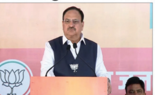
भी ऐसे ही रहोगे।" नड्डा ने कोविड-19 वैश्विक महामारी के खिलाफ भारत के सफल अभियान का जिक्र किया और कहा कि प्रधानमंत्री मोदी के नेतृत्व में देश में चिकित्सा के अलग-अलग क्षेत्रों में मजबूत बुनियादी ढांचा

इंदौर (मध्यप्रदेश) (एजेंसी)। केंद्रीय मंत्री और भारतीय जनता पार्टी (भाजपा) के राष्ट्रीय अध्यक्ष जेपी नड्डा ने विपक्षी दलों पर तंज कसते हुए कहा कि भाजपा के नेतृत्व में देश बदल चुका है लेकिन विपक्षी दलों का 'विपक्ष का दर्जा' अब तक नहीं बदला। नड्डा, प्रधानमंत्री नरेंद्र मोदी की अगुवाई वाली सरकार में स्वास्थ्य और परिवार कल्याण मंत्री हैं। उन्होंने विश्व एड्स दिवस पर इंदौर में आयोजित राष्ट्रीय कार्यक्रम के दौरान कहा, "मैं आज राजनीति नहीं करना चाहता हूँ लेकिन कई लोग बोलते हैं कि देश में कुछ भी नहीं बदला है। मैं उन्हें बस इतना बोलता हूँ कि तुम्हारा स्टेटस (दर्जा) नहीं बदला, बाकी सब बदल गया है। तुम विपक्ष के विपक्ष में ही रहे और ऐसे रहोगे, तो आगे