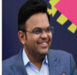
संभावनाएं हैं, और मैं इन अवसरों का लाभ उठाने और खेल को नई ऊंचाइयों पर ले जाने के लिए आईसीसी टीम और सदस्य देशों के साथ मिलकर काम करने को लेकर उत्साहित हूँ।

दुबई (एजेंसी)। जय शाह ने 1 दिसंबर को अंतर्राष्ट्रीय क्रिकेट परिषद (आईसीसी) के नये अध्यक्ष के रूप में अपनी पद संभाल लिया। जय शाह ने ग्रेग बार्कले की जगह ली है। बाकले नवंबर 2020 से इस पद पर थे। आईसीसी प्रमुख के रूप में अपने अपने संबोधन में शाह ने कहा कि लक्ष्य लॉस एंजिल्स 2028 ओलंपिक्स खेलों में क्रिकेट को शामिल किये जाने और महिलाओं के खेल के विकास को प्रथमिकता देने पर वह ध्यान देंगे।