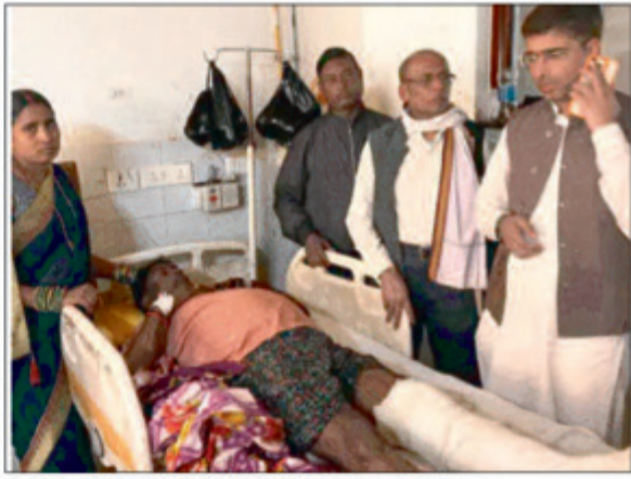
घटनास्थल का निरीक्षण करें। दबंग आगामी दिनों में बड़ी घटना को अंजाम देने के फिदाक में लगे हुए हैं। राजद के नेताओं के द्वारा साजिश की जा रही है। इस मामले में अन्य अभियुक्तों की भी जल्द से जल्द गिरफ्तारी हो और स्पिडी ट्रयाल चलाकर उन्हें कड़ी से कड़ी सजा दिलाया जाए। ताकि पीड़ित पक्ष को जल्द से जल्द न्याय मिले और जो खौफ का माहौल बना हुआ है वह खत्म हो। राजद नेता