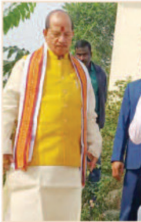
पर्यटन स्थल के रूप में लखीसराय का होगा विकास, लोगों ने पहल का किया स्वागत

लखीसराय। उपमुख्यमंत्री विजय कुमार सिन्हा ने शनिवार को लखीसराय के ऐतिहासिक लाली पहाड़ी का निरीक्षण किया। इस अवसर पर जिलाधिकारी मिथलेश मिश्र भी उपस्थित रहे। डीएम ने उपमुख्यमंत्री को पहाड़ी पर चल रहे विकास और सौंदर्यीकरण कार्यों की जानकारी दी। लाली पहाड़ी का संरक्षण करना हमारी जिम्मेदारी इस दौरान डिप्टी सीएम ने कहा कि लाली पहाड़ी बिहार की सांस्कृतिक विरासत का एक महत्वपूर्ण हिस्सा है। यह स्थल हमारी संस्कृति और इतिहास को समेटे हुए है और इसे संरक्षित करना हमारी जिम्मेदारी है। उन्होंने कहा कि राज्य सरकार सांस्कृतिक धरोहरों के संरक्षण और संवर्धन के लिए पूरी तरह प्रतिबद्ध है। डिप्टी सीएम ने लाली पहाड़ी को प्रमुख पर्यटन स्थल के रूप में