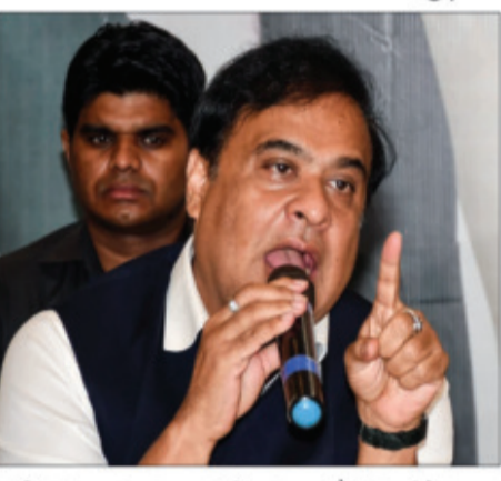
कांग्रेस-भाजपा का चुनाव जीतना गलत है।" शर्मा ने सवाल किया, "मैं जानना चाहता हूं कि क्या कांग्रेस मतदाताओं को गोमांस की पेशकश करके सामगुड़ी जीत रही थी। वह सामगुड़ी को अच्छी तरह से जानते हैं। क्या इसका मतलब यह है कि गोमांस की पेशकश करके सामगुड़ी जीता जा सकता है?" शर्मा