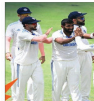
भारत की खिलाड़ियों का जश्न मनाया।

नई दिल्ली (एजेंसी)। भारत और ऑस्ट्रेलिया के बीच वर्षों से प्रभावित तीसरा टेस्ट मैच द्रु रहने के बाद वेस्ट इंडीज चैम्पियनशिप (डब्ल्यूटीसी) फाइनल की दौड़ और रोमांचक हो गई है। आठ टीमों में से दो को फाइनल के लिए 5 दावेदारों में से चुना जाएगा। इन 5 में से कोई भी टीम ना तो फाइनल में जगह बना पाई है और ना ही पूरी तरह से बाहर है। भारत, ऑस्ट्रेलिया और दक्षिण अफ्रीका अभी भी मजबूत दावेदारी पेश कर रहे हैं, जबकि श्रीलंका और पाकिस्तान दूसरों के भरोसे अभी भी रस में हैं।