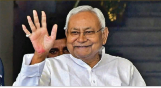
का उद्घाटन करेंगे। इन योजनाओं का उद्देश्य ग्रामीण क्षेत्र के चहुंमुखी विकास को बढ़ावा देना है। इसके बाद सीएम बेतिया के कर्झाया जाएंगे, जहां वह बाईपास रोड का निरीक्षण

पटना (एजेंसी)। बिहार के सीएम नीतीश कुमार प्रगति यात्रा की शुरुआत 23 दिसंबर को पश्चिम चंपारण जिले के वाल्मीकिनगर से करेंगे। इस यात्रा का उद्देश्य सरकार की योजनाओं का जमीनी हकीकत से रूबरू होना और विकास कार्यों का निरीक्षण करना है। सीएम नीतीश सबसे पहले वाल्मीकिनगर के घोटहवा टोला पहुंचेंगे, जहां वह लोगों को संबोधित करेंगे और सरकार द्वारा किए गए कार्यों का ब्यौरा देंगे। इसके बाद वह मझौलिया के धोकहा पंचायत स्थित शिकारपुर गांव जाएंगे। यहां वह मनरेगा पार्क का दौरा करेंगे जिसे विशेष रूप से सजाया जा रहा है। प्रगति यात्रा के दौरान सीएम नीतीश एसडीआरएफ ट्रेनिंग सेंटर और मनरेगा पार्क