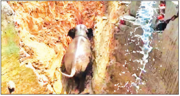
रेस्क्यू अभियान में स्थानीय लोगों ने की मदद

रांची : झारखंड की राजधानी रांची के बुंदू वन प्रक्षेत्र अंतर्गत सोनाहातू थाना क्षेत्र के सारयाद गांव में उस वक्त अफरा-तफरी मच गई, जब एक जंगली हाथी अचानक खुले कुएं में गिर गया। घटना की खबर फैलते ही आसपास के गांवों से सैकड़ों ग्रामीण मौके पर जुट गए, जिससे पूरे इलाके में सनसनी का माहौल बन गया।