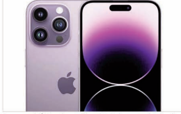
विचार कर रहे हैं कि मॉडल लाने में देरी करें या कम स्पेसिफिकेशन्स वाले फोन पेश करें।

निकट भविष्य में सुधार के कोई संकेत नहीं हैं। शायद चौथी तिमाही या उसके बाद ही ऐसा हो, क्योंकि मेमरी की कमी कम से कम डेढ़ साल तक बनी रहने की आशंका है। आईडीसी इंडिया में एसोसिएट उपाध्यक्ष ने कहा कि डीलरों को भेजी जाने वाली स्मार्टफोन की खेप में तेज गिरावट शायद वैश्विक महामारी के बाद दूसरी ऐसी घटना हो सकती है, जब ज्यादा इनपुट लागत के शुरुआती झटके को वैश्विक पर महसूस किया गया था। उन्होंने कहा कि ब्रांड इस बात पर