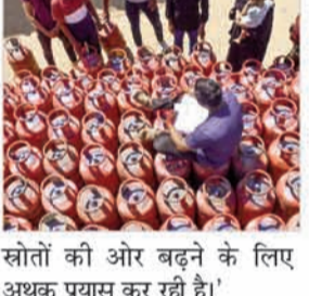
स्रोतों की ओर बढ़ने के लिए अथक प्रयास कर रहे हैं।

वाणिज्यिक तरलकृत पेट्रोलियम गैस (एलपीजी) सिलिंडरों की आपूर्ति तंग होने के बीच रेस्तरां उद्योग करीब 79,000 करोड़ रुपये तक का नुकसान उठा सकता है। इसका कारण कई रेस्तरां अपने आउटलेट बंद कर रहे हैं या फिर कारोबार चलाने के नाम पर काफी कम व्यंजन ही परोस पा रहे हैं। नेशनल रेस्टोरेंट एसोसिएशन ऑफ इंडिया द्वारा किए गए आंतरिक सर्वेक्षण के अनुसार रेस्तरां उद्योग को प्रति माह 79,000 करोड़ रुपये तक का नुकसान हो सकता है, क्योंकि उत्पादन से जुड़ी गतिविधियां 15-20 प्रतिशत तक कम हो गई हैं। देश भर में 5 लाख से अधिक रेस्तरां का प्रतिनिधित्व करने वाले उद्योग संगठन के अनुसार देश के करीब 10 प्रतिशत रेस्तरां अस्थायी रूप से बंद हुए हैं, जबकि 60-70 प्रतिशत इंडवशन स्टोव और वैकल्पिक ईंधनों के सहारे चल रहे हैं। रेस्तरांओं में काम कम हो गए हैं और व्यंजनों की सूची छोटी हो गई है। डोमिनोज और पोपपेज का संचालन करने वाली जुबिलेंट फूडवर्क्स ने कहा कि देश भर में व्यावसायिक एलपीजी के वितरण में आपूर्ति संबंधी बाधाओं का सामना करना पड़ रहा है। इसमें कहा गया है, 'कंपनी के स्टोर नेटवर्क के कुछ हिस्सों में एलपीजी सिलिंडरों की आपूर्ति बाधित हुई है कंपनी एलपीजी संरक्षण के लिए कई कदम उठा रही है और बिजली और पाइपलाइन प्राकृतिक गैस (पीएनजी) जैसे वैकल्पिक ऊर्जा