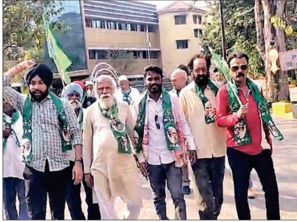
किसी भी सभ्य समाज में स्वीकार्य नहीं है और इससे समाज में भय एवं असुरक्षा का वातावरण बनता है। झामुमो कार्यकर्ताओं ने मांग की है कि इस जघन्य हत्याकांड के