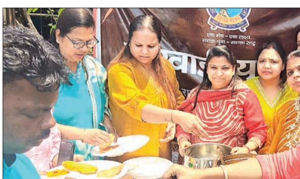
युवाओं को समाज के प्रति जागरूक और जिम्मेदार बनाने की दिशा में काम किया जाएगा। हनुमान जयंती पर सेवा कार्य से शुरूआत नए सत्र की शुरूआत हनुमान जयंती के अवसर पर एक सेवा कार्यक्रम के साथ की गई। संकट मोचन मंदिर के बाहर राहगीरों, आंटी चालकों और जरूरतमंद लोगों के बीच पुरी, सब्जी, बुंदिया, केला, टॉफी और शरबत का वितरण किया गया। इस दौरान पूरे क्षेत्र में भक्तिमय वातावरण बना रहा और लोगों ने इस पहल की सराहना की।

रामगढ़ : रामगढ़ में मारवाड़ी युवा मंच की चेतना शाखा ने सत्र 2026-27 के नए कार्यकाल की शुरूआत उत्साह और सेवा भावना के साथ की। संगठन के नियमों के तहत हर वर्ष नई कार्यकारिणी का गठन किया जाता है और इस बार भी नई टीम ने विधिवत रूप से कार्यभार संभाल लिया। नए सत्र का मुख्य उद्देश्य "एक मंच - एक लक्ष्य, सशक्त युवा - सशक्त राष्ट्र" के विजन को आगे बढ़ाना है। पंचसूत्र पर रहेगा विशेष फोकस नई कार्यकारिणी ने जनसेवा, समाज सुधार और व्यक्तित्व विकास को प्राथमिकता देते हुए पंचसूत्र के तहत कार्य करने का संकल्प लिया है। इसके माध्यम से