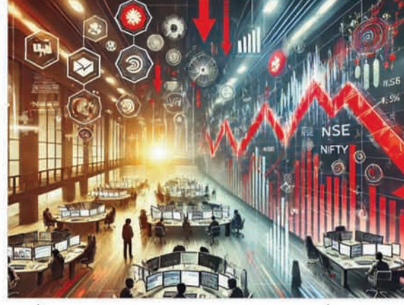
रुख के साथ 23,909 पर खुला और बाद में हल्की गिरावट के साथ 23,944 के आसपास कारोबार करता नजर आया।

179.25 अंक या 0.32 फीसदी की बढ़त के साथ 56,978.75 और निफ्टी स्मॉलकैप 100 इंडेक्स 27.95 अंक या 0.17 फीसदी की तेजी के साथ 16,566 पर बंद हुआ। बाजार जानकारों के अनुसार मुनाफावसूली से भी बाजार गिरा है। इससे पहले आज सुबह एशियाई बाजारों से मिले कमजोर संकेतों और घरेलू स्तर पर बैंकिंग व आईटी शेयरों में बिकवाली के कारण बाजार गिरावट के साथ खुले। सैंसेक्स करीब 300 अंकों की गिरावट के साथ 77,319 पर खुला। वहीं निफ्टी भी कमजोर