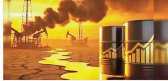
जहाजों को ही गुजरने देगा और टोल वसूलेगा, जबकि डोनाल्ड ट्रंप ने इसे टोल फी करने का दावा किया। इस भिन्न रुख से बाजार में अनिश्चितता बनी हुई है। विशेषज्ञ मानते हैं कि हाल का तनाव अब तक के सबसे बड़े तेल संकटों में से एक बन सकता है। पहले यह तनाव कच्चे तेल की कीमत 120 डॉलर प्रति बैरल तक ले गया था, जो 2022 के बाद का उच्चतम स्तर था। शिपिंग कंपनियों स्पष्टता मिलने तक आवाजाही सामान्य नहीं करेगी, जिससे वैश्विक सप्लाई पर दबाव बना हुआ है।

बेंचमार्क 100 डॉलर के नीचे फिसल गए थे, जिसमें डब्ल्यूटीआई ने अप्रैल 2020 के बाद सबसे बड़ी गिरावट दर्ज की थी। स्ट्रेट आफ होर्मुज वैश्विक तेल आपूर्ति का लगभग 20 फीसदी मार्ग है। ईराक, सऊदी अरब, कुवैत और कतर जैसे प्रमुख तेल उत्पादक देशों के निर्यात इसी मार्ग से होते हैं। इसलिए इस मार्ग में किसी भी बाधा से पूरी दुनिया में तेल की कीमतें प्रभावित हो सकती हैं। सीजफायर की घोषणा के बावजूद बुधवार को इस स्ट्रेट से केवल 4 जहाज गुजर पाए। ईरान ने कहा कि वह रोजाना केवल 12