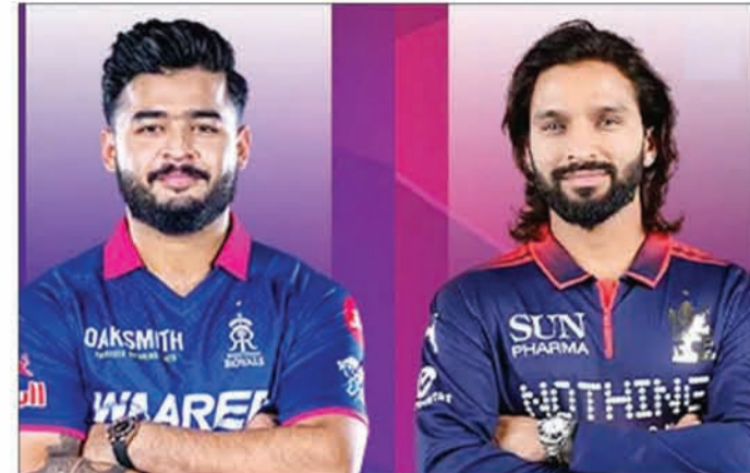
जाती है। ऐसे में यहां बड़े स्कोर वाला मैच करनी होगी। इस मैच में दोनों ही टीमों में जीत दर्ज कर अपना हॉसला बढ़ाना चाहेंगे।

अब तक अच्छा प्रदर्शन किया है। ऐसे में ये मुकाबला काटे का होना तय है। दोनों की ही बल्लेबाज मजबूत हैं। राजस्थान के पास यशस्वी जायसवाल और वैभव सूर्यवंशी जैसे बल्लेबाज हैं वहीं आरसीबी के पास विराट कोहली और रजत पाटीदार जैसे बल्लेबाज हैं। गेंदबाजी में हालांकि रॉयल्स ज्यादा मजबूत नजर आती है। आरसीबी के पास जैकब डफ्री और भुवनेश्वर कुमार जबकि रॉयल्स के पास जोफ्रा आर्चर और नांदे बर्गर जैसे तेज गेंदबाज हैं।