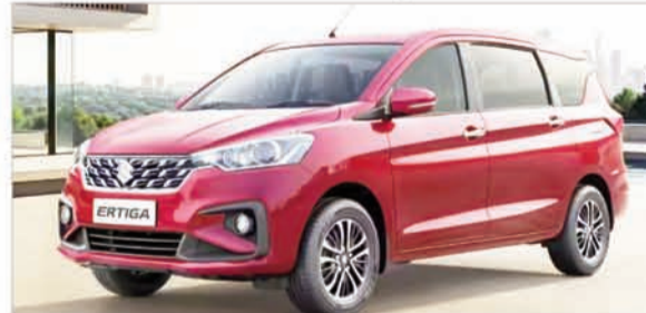
निकाल लेते हैं। देशभर में सीएनजी पंपों की संख्या भी तेजी से बढ़ी है, जिससे महंगे ईंधन की तुलना में सीएनजी भरवाना आसान हो गया है। मारुति, हुंडई और टाटा जैसे ब्रांड फेक्ट्री-फिटेड सीएनजी कारें पेश कर रहे हैं। अब हैचबैक, सेडान और एसयूवी तक सीएनजी पोर्टफोलियो फैल गया है। टाटा ने वित्त वर्ष 26 में 1.72 लाख सीएनजी यूनिट बेचीं, जो सालाना 24 फीसदी की बढ़त है। सीएनजी की लोकप्रियता सिर्फ कारों तक सीमित नहीं रही। बजाज ने दुनिया की पहली सीएनजी बाइक फीडम 125 लॉन्च की, जबकि टीवीएस ने जूपीटर सीएनजी पर काम शुरू किया है।

जिनमें लगभग 10.34 लाख सीएनजी कारें थीं। इसका मतलब है कि सीएनजी की हिस्सेदारी अब 22 प्रतिशत तक पहुंच गई है, जबकि तीन साल पहले यह केवल 12-13 प्रतिशत थी। पेट्रोल का शेयर घटकर 47.48 फीसदी और डीजल का 18.08 फीसदी रह गया है, जबकि इलेक्ट्रिक वाहनों की हिस्सेदारी बढ़कर 4.25 फीसदी हो गई है। सीएनजी का खर्च प्रति किलोमीटर पेट्रोल से 40-50 फीसदी तक कम है। भले ही सीएनजी कारें 80,000-1,00,000 रुपये महंगी हों, 15,000-20,000 किलोमीटर सालाना चलाने वाले लोग अतिरिक्त लागत 18 महीनों में