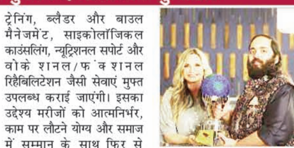
और उनके परिवारों के जीवन पर स्थायी प्रभाव डालेगा, उन्हें उम्मीद और सम्मान के साथ आगे बढ़ने में मदद करेगा।

से ठीक पहले लिया। जीएसआईएफ ने उनके उदार योगदान के लिए आभार जताया। फाउंडेशन के अनुसार, इस योगदान से मरीजों को 50 दिन या उससे अधिक समय तक पूर्ण, मुफ्त और व्यापक रिहैबिलिटेशन सेवाएं प्राप्त होंगी, जो उनकी व्यक्तिगत रिकवरी आवश्यकताओं पर आधारित होंगी। इस पहल के तहत मरीजों को मेडिकल केयर, फिजियोथेरेपी, ऑक्यूपेशनल थेरेपी, मोबिलिटी और व्हीलचेयर