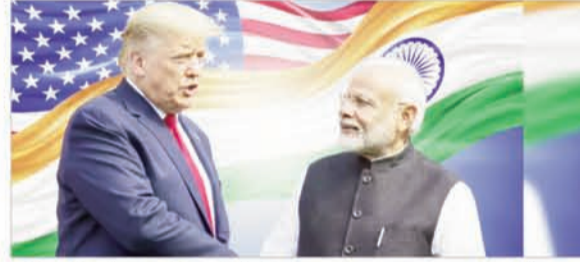
अधिकारी और व्यापारिक प्रतिनिधि मौजूद थे। भारत-अमेरिका संबंधों में पिछले वर्ष मई में कुछ तनाव देखा गया था। राष्ट्रपति डोनाल्ड ट्रंप के विवादित दावों और वाशिंगटन द्वारा लगाए गए दंडात्मक शुल्क के बाद रिश्तों में गिरावट आई थी। फरवरी में दोनों देशों ने आपसी लाभकारी व्यापार के लिए अंतरिम समझौते के ढांचे पर सहमति व्यक्त की।

करेगा और नए व्यापारिक अवसरों को उत्पन्न करने में मदद करेगा। पोर्टल का उद्देश्य दोनों देशों के व्यवसायियों के लिए सहयोग और संपर्क को सरल बनाना है। विदेश सचिव बुधवार से अपनी तीन दिवसीय यात्रा पर अमेरिका में हैं। इस दौरान उन्होंने अमेरिकी अधिकारियों के साथ द्विपक्षीय व्यापार, रक्षा सहयोग और वैश्विक घटनाक्रम जैसे मध्य पूर्व संकट पर चर्चा करेंगे। इस अवसर पर अमेरिका में भारत के राजदूत समेत दोनों देशों के वरिष्ठ