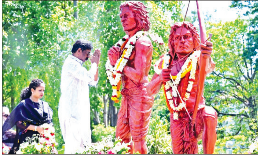
आदिवासी समुदाय के लिए गर्व का क्षण

मुख्यमंत्री ने सिदो-कान्हू की जयंती को भारत के इतिहास का एक गौरवशाली दिन बताया। उन्होंने कहा कि इन महान विभूतियों का समर्पण और अदम्य साहस आज भी लाखों लोगों के दिलों में जीवित है। आज पूरे राज्य और देश में लोग आदर और सम्मान के साथ उनकी