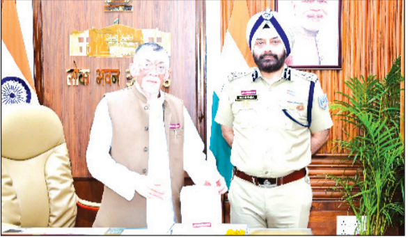
प्रत्यूष नवबिहार संवाददाता