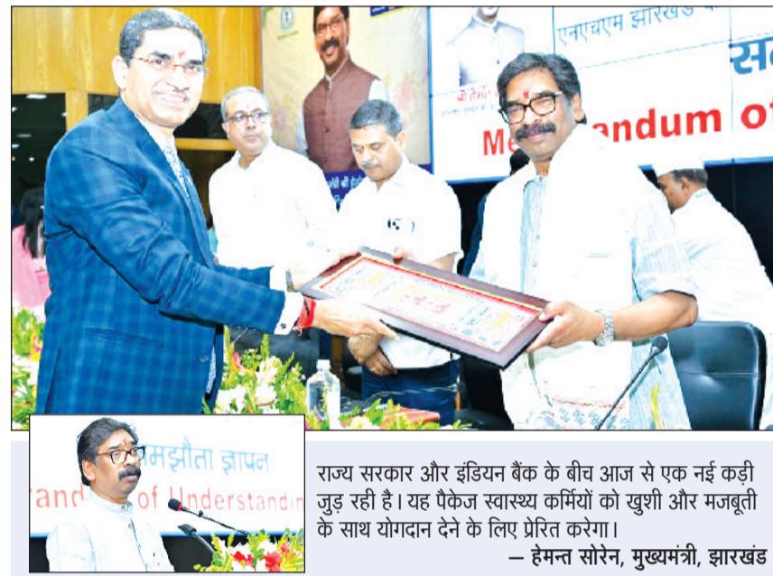
राज्य सरकार और इंडियन बैंक के बीच आज से एक नई कड़ी जुड़ रही है। यह पैकेज स्वास्थ्य कर्मियों को खुशी और मजबूती के साथ योगदान देने के लिए प्रेरित करेगा। — हेमन्त सोरेन, मुख्यमंत्री, झारखंड

रांची : झारखंड के मुख्यमंत्री श्री हेमन्त सोरेन की उपस्थिति में बुधवार को झारखंड सरकार और इंडियन बैंक के बीच एक ऐतिहासिक समझौता ज्ञापन पर हस्ताक्षर किए गए। इस समझौते के तहत राज्य के स्वास्थ्य विभाग और राष्ट्रीय स्वास्थ्य मिशन के हजारों कर्मियों को विशेष 'सैलरी अकाउंट पैकेज' और 'एचआरआईएस पैकेज' का लाभ मिलेगा। जोरिखिम के बीच कार्य करने वाले कर्मियों को मिलेगी वित्तीय सुरक्षा समारोह को संबोधित करते हुए मुख्यमंत्री ने कहा कि स्वास्थ्य कर्मियों अक्सर संक्रमण और जोरिखिम भरे क्षेत्रों में अपनी जान की परवाह किए बिना काम करते हैं। कोरोना महामारी का जिक्र करते हुए उन्होंने कहा कि ऐसी आपदाओं के समय स्वास्थ्य कर्मियों को बचाने में मौलिक भूमिका साबित होगी। विकास में बैंकों की भूमिका अहम मुख्यमंत्री ने इंडियन बैंक के पदाधिकारियों को शुभकामनाएं देते