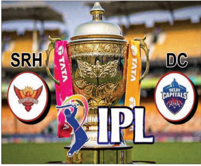
मुकाबलों में से सनराइजर्स ने 13 जबकि दिल्ली कैपिटल्स ने 12 मैच जीते हैं। ऐसे में इस बार भी इनके बीच कड़े मुकाबले की उम्मीदें हैं।