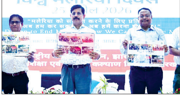
विभिन्न जिलों के मुखियाओं और जेएसएलपीएस की दीदियों को किया गया सम्मानित