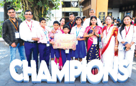
प्रत्युष नवबिहार संवाददाता

रांची: मुंबई में आयोजित प्रतिष्ठित 'नेशनल वर्ड पावर चैंपियनशिप 2025-26' में झारखंड के सरकारी स्कूलों के नन्हें विद्यार्थियों ने अपनी अंग्रेजी दक्षता का लोहा मनवाते हुए राज्य का नाम रोशन किया है। कक्षा 2 से 5 तक के इन बच्चों ने राष्ट्रीय स्तर पर उत्कृष्ट प्रदर्शन कर यह साबित कर दिया है कि झारखंड की बुनियादी शिक्षा की नींव मजबूत हो रही है। विद्यार्थियों की इस शानदार उपलब्धि पर मुख्यमंत्री श्री हेमन्त सोरेन ने हर्ष व्यक्त किया है। उन्होंने सफल छात्र-छात्राओं, उनके अभिभावकों और शिक्षकों को बधाई देते हुए कहा "झारखंड के नन्हें सितारों का राज्य स्तरीय प्रतियोगिता से निकलकर मुंबई में राष्ट्रीय मंच पर अपनी योग्यता साबित करना अत्यंत गर्व का विषय है। यह सफलता राज्य में शिक्षा की मजबूत नींव को दर्शाती है। हमारी सरकार बच्चों को वैश्विक स्तर के अवसर प्रदान करने के लिए पूरी तरह प्रतिबद्ध है।" झारखंड के इन बच्चों ने पहले राज्य स्तरीय फाउंडेशनल लिटरेसी एंड न्यूमेरीसी चैंपियनशिप जीती और उसके बाद 22 अप्रैल 2026 को मुंबई में आयोजित राष्ट्रीय प्रतियोगिता में हिस्सा लिया। इस कार्यक्रम का आयोजन झारखंड शिक्षा परियोजना परिषद और इंग्लिश लिटरेसी पार्टनर लीप फॉर वर्ड के साझे सहयोग से किया गया। इसका मुख्य उद्देश्य प्राथमिक स्तर के बच्चों में अंग्रेजी भाषा की बुनियादी समझ और पकड़ को सुदृढ़ करना है।