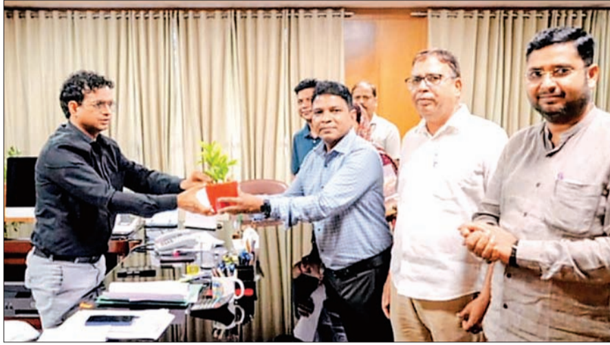
महिलाओं को मिलने वाले शिशु देखभाल अवकाश को जिले के विभिन्न विभागों में बिना अड़चन