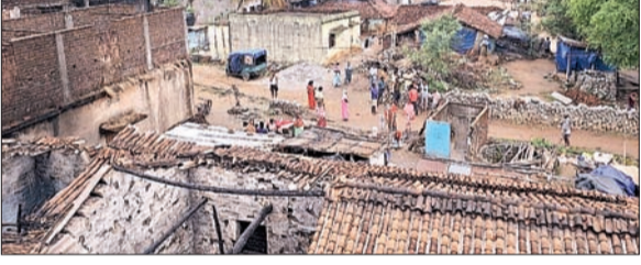
प्रत्युष नवबिहार संवाददाता