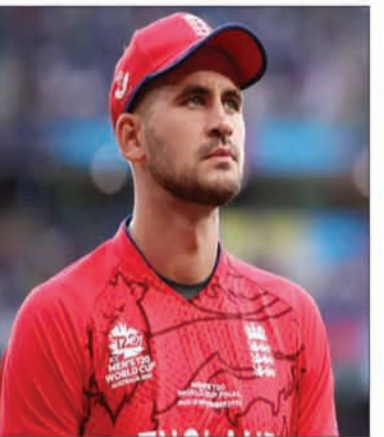
लागाकर 99 रन बनाए। हामिद भी 99 पर पहुंचकर आउट हो गये। साल 2024 में थाईलैंड के वेल्स में

लंदन (एजेंसी)। टी20 अंतरराष्ट्रीय क्रिकेट जैसे छोटे प्रारूप में जहां कई खिलाड़ियों ने शतक लगाये हैं। वहीं कई खिलाड़ी ऐसे भी रहे हैं जो केवल एक रन से शतक नहीं लगा पाये हैं। टी20 अंतरराष्ट्रीय क्रिकेट में 99 पर आउट होने वाले पहले बल्लेबाज इंग्लैंड के आक्रामक सलामी बल्लेबाज एलेक्स हेल्स थे। साल 2012 में नॉटिंगहम के मैदान पर वेस्टइंडीज के खिलाफ खेले गए एक मुकाबले में हेल्स ने केवल 68 गेंदों में 99 रन बनाये। अपनी इस पारी में उन्होंने 6 चौके और 4 छके लगाये थे पर वह अपना पहला शतक पूरा नहीं कर पाये। रवि रामपील की एक गेंद पर वह आउट हो गये। वह टी20 अंतरराष्ट्रीय में 99 पर आउट होने वाले पहले खिलाड़ी रहे हैं। वहीं 99 पर आउट होने वाले दूसरे बल्लेबाज डेनमार्क के हामिद शाह रहे हैं। साल 2022 में हामिद ने फिनलैंड के खिलाफ 68 गेंदों में 6 चौके और 4 छके