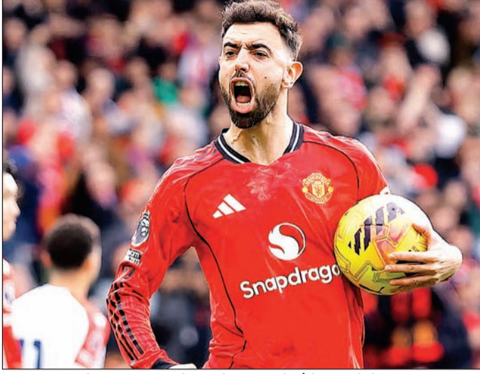
प्रीमियर लीग के एक सीजन में सबसे ज्यादा अस्सिस्ट के रिकॉर्ड की बराबरी कर ली। अब वह थिएरी हेनरी और केविन डी ब्रूनो जैसे दिग्गजों के साथ संयुक्त रूप से इस सूची में शामिल हो गए हैं। सीजन की शुरुआत में मैनचेस्टर

एजेंसी नई दिल्ली : ब्रूनो फर्नांडिस को प्रीमियर लीग 2025-26 सीजन का सर्वश्रेष्ठ खिलाड़ी चुना गया है। पुर्तगाल के इस दिग्गज फुटबॉलर ने पहली बार यह प्रतिष्ठित पुरस्कार अपने नाम किया। ब्रूनो फर्नांडिस ने पूरे सीजन शानदार प्रदर्शन करते हुए मैनचेस्टर यूनाइटेड को यूईएफए चैंपियंस लीग में वापसी दिलाने में अहम भूमिका निभाई। उन्होंने 37 लीग मैचों में 8 गोल और 20 अस्सिस्ट दर्ज किए। इस तरह वह कुल 28 गोलों में सीधे तौर पर शामिल रहे और टीम को अंक तालिका में तीसरे स्थान तक पहुंचाने में सफल रहे। सीजन का उनका 20वां अस्सिस्ट नॉटिंघम फॉरेस्ट के खिलाफ 3-2 की जीत में आया, जब उन्होंने ब्रायन मबेउमो के लिए गोल तैयार किया। इसके साथ ही उन्होंने