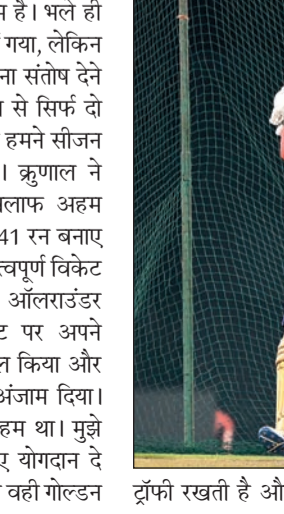
ट्रॉफी रखती है और वही हमारा लक्ष्य है।

महीनों की मेहनत का परिणाम है। भले ही आज नतीजा हमारे पक्ष में नहीं गया, लेकिन 14 मैचों के बाद शीर्ष पर रहना संतोष देने वाला है। अब हम उस लक्ष्य से सिर्फ दो कदम दूर हैं, जिसकी कल्पना हमने सीजन शुरू होने से पहले की थी। कृणाल ने सनराइजर्स हैदराबाद के खिलाफ अहम योगदान देते हुए 31 गेंदों पर 41 रन बनाए और हेनरिक क्लासेन का महत्वपूर्ण विकेट भी हासिल किया। 35 वर्षीय ऑलराउंडर ने कहा, उन्होंने इस विकेट पर अपने अनुभव का बेहतरीन इस्तेमाल किया और धीमी गेंदों को अच्छी तरह अंजाम दिया। क्लासेन का विकेट बेहद अहम था। मुझे खुशी है कि मैं टीम के लिए योगदान दे पाया, लेकिन आखिर में मान्ये वही गोल्टन