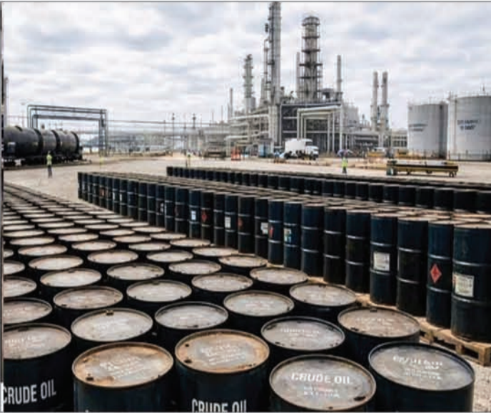
राणनीतिक भंडार मौजूद है। इस गंभीर स्थिति को देखकर मोदी सरकार को पांच प्रमुख क्षेत्रों कच्चा तेल, खाद, रेयर अर्थ मटेरियल, जरूरी दवाइयां और मेडिकल इंस्ट्रूमेंट्स में बड़े रिजर्व बनाने की सलाह दी है। रिपोर्ट में कहा गया है कि इन भंडारों से वैश्विक सफाई चैन बाधित होने पर भी देश में जरूरी सामान

नई दिल्ली (एजेंसी)। वैश्विक तनाव और कच्चे तेल की बढ़ती कीमतों के बीच, कंसल्टेंसी फर्म ने भारत को भविष्य के संकटों से बचने के लिए एक बड़ा राणनीतिक भंडार तैयार करने की चेतावनी दी है। फर्म को मई 2026 की रिपोर्ट के अनुसार, भारत के पास वर्तमान में केवल 4-5 दिनों की घरेलू जरूरतों को पूरा करने के लिए ही कच्चा तेल राणनीतिक भंडार में है, जो आम लोगों की जेब पर पेट्रोल, डीजल, एलपीजी और खाद की कीमतों में भारी उछाल के रूप में सीधा असर डाल सकता है। रिपोर्ट में पश्चिम एशिया में जारी संकट को बड़ी वजह माना गया है, जिससे भारत की आयात पर अत्यधिक निर्भरता को उजागर किया है। कंसल्टेंसी फर्म का कहना है कि अगर वैश्विक संकट लंबा खिंचता है, तब ईंधन की बढ़ती कीमतें सिर्फ पेट्रोल पंप तक सीमित नहीं रहेंगी, बल्कि ट्रांसपोर्ट, बिजली, खेती और रोजगारों के खर्चों को भी महंगा करेगी। विशेष रूप से, महंगे उर्वरक सीधे तौर पर खाद महंगाई को बढ़ावा देने वाले हैं, जिससे आम आदमी का बजट और बिगड़ सकता है। भारत के सीमित भंडार की तुलना में चीन और जापान जैसे देशों के पास कहीं अधिक बड़े