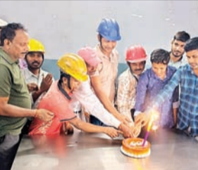
प्रत्यूष नवबिहार संवाददाता रामगढ़ : बिहार फार्मलर्ज़ी एंड कास्टिंग्स लिमिटेड (बीएफसीएल) में कर्मचारियों के प्रति सम्मान और संगठनात्मक संस्कृति को सशक्त बनाने की दिशा में एक अनूठी पहल के तहत मई माह में जन्मदिन मनाए जाने वाले 148 कर्मचारियों का सामूहिक जन्मदिन समारोह धूमधाम से मनाया गया। पीपुल फर्स्ट कल्चर और वन सैलिब्रेशन, मेनी स्मार्ट्स थ्रीम पर आयोजित इस कार्यक्रम ने पूरे परिसर को उत्साह, उमंग और पारिवारिक माहौल से सराबोर कर दिया। 30 मई को आयोजित इस विशेष समारोह में जीएफए, एचएसपीए तथा हेड ऑफिस रांची के कर्मचारियों ने सहभागिता निभाई। विभिन्न विभागों के कर्मचारियों ने एक साथ मिलकर जन्मदिन का जश्न मनाया और

संगठन में आपसी सौहार्द व एकता का संदेश दिया। कार्यक्रम में विभिन्न विभागध्यक्षों की गरिमामयी उपस्थिति रही। उनकी सहभागिता ने कर्मचारियों का उत्साह बढ़ाया और यह संदेश दिया कि संस्था अपने प्रत्येक कर्म को परिवार कर महत्वपूर्ण सदस्य मानती है। आयोजन एचएसपी कैंटीन, जीएफए कैंटीन एवं मुख्य कार्यालय परिसर में किया गया। समारोह के दौरान सामूहिक केक कटिंग की गई। जन्मदिन मनाते वाले सभी कर्मचारियों को शुभकामनाएं दी गईं