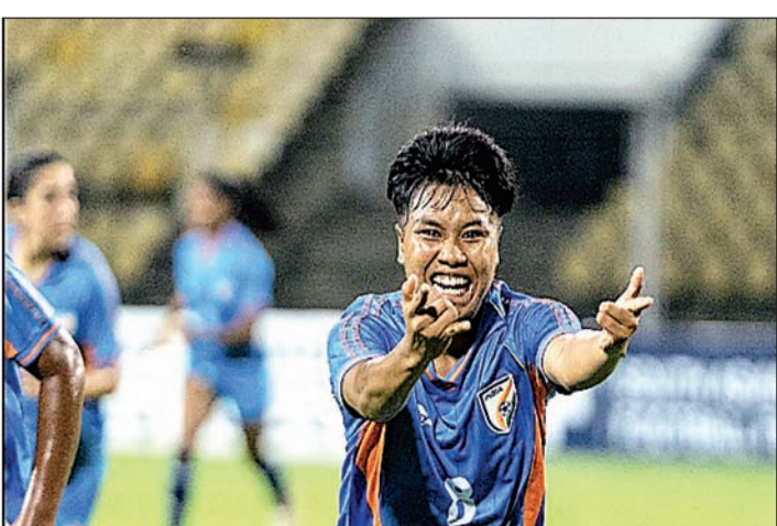
आक्रमण को लंबे समय तक रोके रखा। फीफा रैंकिंग में 69वें स्थान पर मौजूद

एजेंसी गोवा : पांच बार की चैम्पियन भारतीय महिला फुटबॉल टीम ने सैफ महिला चैम्पियनशिप 2026 के दूसरे सेमीफाइनल में बुधवार रात भूटान को 1-0 से हराकर फाइनल में प्रवेश कर लिया। अब खिताबी मुकाबले में भारत का सामना मौजूदा चैम्पियन बांग्लादेश से शनिवार को पंडित जवाहरलाल नेहरू स्टेडियम में होगा। ग्रुप चरण में दो मैचों में 14 गोल करने वाली भारतीय टीम से एकतरफा प्रदर्शन की उम्मीद थी, लेकिन भूटान ने शानदार रक्षात्मक खेल दिखाते हुए मुकाबले को कड़ा बनाए रखा। लगातार तीसरी बार सेमीफाइनल में पहुंची भूटान की टीम ने भारतीय