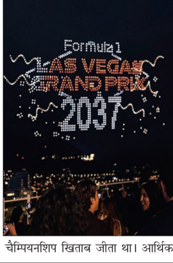
चैंपियनशिप खिताब जीता था। आर्थिक

आयोजन नहीं बल्कि खेल, मनोरंजन, व्यवसाय और पर्यटन का वैश्विक मंच बन चुकी है। 6.2 किलोमीटर लंबे लास वेगास स्ट्रिप सर्किट पर ड्राइवर 322 किमी प्रति घंटे (200 मील प्रति घंटा) से अधिक की रफ्तार से दौड़ते हैं। यह ट्रैक बेलाजियो, सीजर्स पैलेस, विन लास वेगास और द वेनेशियन रिजॉर्ट जैसे प्रतिष्ठित स्थलों के बीच से गुजरता है। रेस के इतिहास में अब तक मैक्स वट्टेपेन ने दो बार (2023 और 2025) जीत हासिल की है, जबकि जॉर्ज रसेल ने 2024 में खिताब अपने नाम किया था। 2024 के आयोजन में कुल 113 ओवरटेक देखने को मिले थे और उसी वर्ष वट्टेपेन ने लगातार चौथा एफआईए फॉर्मूला-1 विश्व