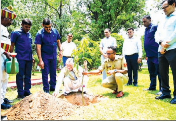
पर्यावरण संतुलन बनाए रखने की जिम्मेदारी केवल सरकारों या संस्थाओं की नहीं, बल्कि प्रत्येक नागरिक की है।

रांची : विश्व पर्यावरण दिवस के अवसर पर झारखंड के राज्यपाल संतोष कुमार गंगवार ने शुक्रवार को रांची स्थित लोक भवन परिसर में पौधारोपण कर पर्यावरण संरक्षण का संदेश दिया। इस अवसर पर उन्होंने लोगों से प्रकृति के प्रति संवेदनशील बनने और अधिक से अधिक पौधे लगाने का आह्वान किया। पौधारोपण कार्यक्रम के दौरान राज्यपाल ने कहा कि पर्यावरण संरक्षण केवल एक दिन मनाने तक सीमित नहीं रहना चाहिए, बल्कि इसे जनभागीदारी के माध्यम से व्यापक जनआंदोलन का स्वरूप दिया जाना चाहिए। उन्होंने कहा कि