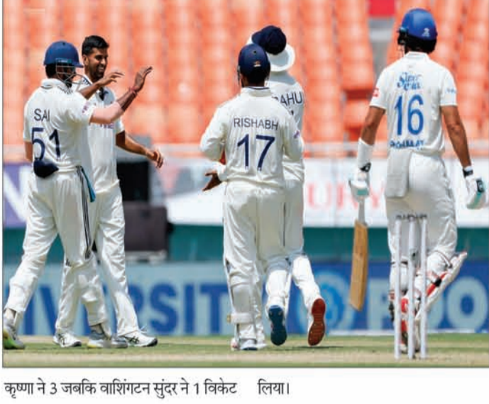
कृष्णा ने 3 जबकि वाशिंगटन सुंदर ने 1 विकेट लिया।

सबसे बड़ी जीत रही। इससे पहले भारतीय टीम ने साल 2018 में वेस्टइंडीज के खिलाफ पारी और 272 रनों से जीत हासिल की थी। इस मैच में भारतीय टीम पूरी तरह से हावी रही। मैच में पहले बल्लेबाजी करते हुए कप्तान शुभमन गिल और केएल राहुल ने शतक लगाये जबकि साई सुदर्शन और ऋषभ पंत ने अर्धशतक लगाया। शुभमन ने 15 चौके और 1 छके की मदद से 126 रनों की पारी खेली जबकि केएल राहुल ने 11 चौके लगाकर 100 रन बनाए। साई सुदर्शन और ऋषभ पंत ने 81-81 रन जबकि वाशिंगटन सुंदर ने 52 रन बनाये। इसके बाद बल्लेबाजी के लिए अफगान टीम सुधार की फिरकी में उलझ गयी और पहली पारी में 152 रन ही बना पायी। केवल रहमत शाह ही 60 रनों की पारी खेली जबकि बाकी सभी बल्लेबाज विफल रहे। सुधार ने सबसे ज्यादा 6 विकेट लिए जबकि प्रसिद्ध