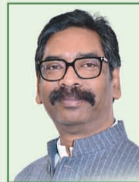
हेमन्त सोरेन मुख्यमंत्री, झारखण्ड