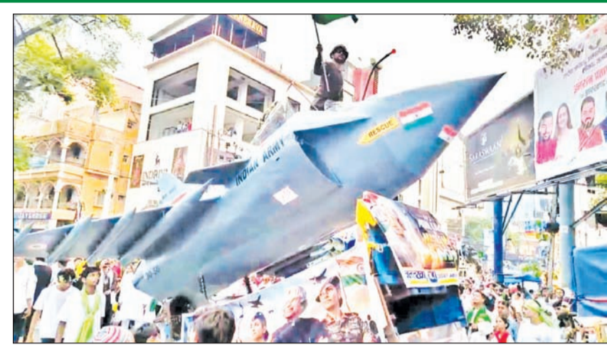
माईघारे के सन्देश के साथ सादगी पूर्वक निकाला गया मुहर्रम का मातमी जुलूस रिपोर्ट पेज 03 पर

और नेतृत्व को लेकर तस्वीर पूरी तरह साफ होगी।