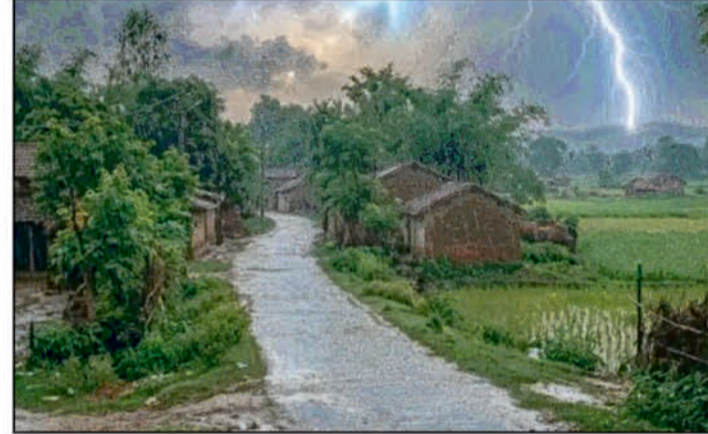
शिवहर, सोतामड़ी, मधुबनी, सुपौल, अररिया, मुजफ्फरपुर, दरभंगा, सहरसा, मधेपुरा, पूर्णिया, किशनगंज, गोपालगंज, सीवान, सारण, कटिहार, वैशाली, समस्तीपुर, खगड़िया, मुंगेर,

पटना (एजेंसी) बिहार में मौसम विभाग की तर्फ से आज डबल अलर्ट जारी किया गया है। 24 जिलों में गरज-चमक के साथ भारी बारिश की चेतावनी जारी की गई है। इस दौरान 40 से 50 किलोमीटर प्रति घंटे की रफ्तार से हवा चलने की भी संभावना जताई गई है। बिहार में आज से अगले तीन दिनों तक मौसम बिगड़े रहने की संभावना जताई गई है। कई जिलों में आज डबल अलर्ट जारी किया गया है। 11 जून को ही राज्य में मॉनसून की एंटी हो गई थी। लेकिन इसके बाद यह कमजोर पड़ गया। उत्तर बिहार के जिलों में हल्की बारिश दर्ज की जा रही लेकिन दक्षिण बिहार में अब भी हीट वेव जैसी स्थिति बनी हुई है। इन 24 जिलों में अर्रंज अलर्ट जारी बिहार के जिन 24 जिलों में अर्रंज अलर्ट जारी किया गया है, उनमें पूर्वी चंपारण, पश्चिम चंपारण,