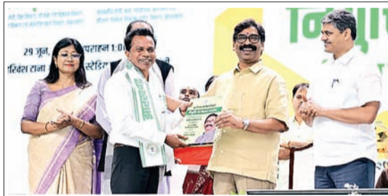
सरकारी विद्यालयों में अद्यनत विद्यार्थियों को क्वालिटी एजुकेशन प्रदान करना प्राथमिकता

मुख्यमंत्री रांची के खेलगांव स्थित टाना भगत इंडोर स्टेडियम में आयोजित 1,042 नव चयनित इंटर एवं स्नातक प्रशिक्षित सहायक आचार्यों के नियुक्ति-पत्र वितरण समारोह को संबोधित कर रहे थे। इस अवसर पर उन्होंने चयनित अभ्यर्थियों को उज्वल भविष्य की शुभकामनाएं देते हुए कहा कि राज्य सरकार ने उन्हें केवल नौकरी नहीं,