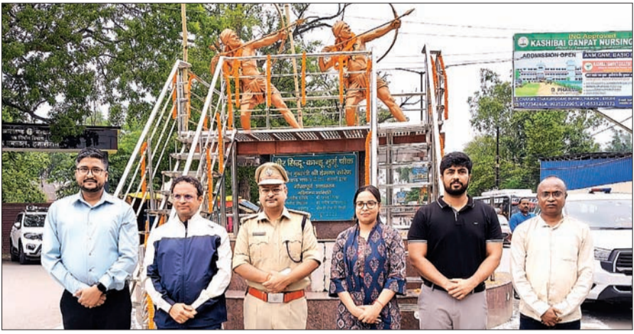
कि सिदो-कान्हू ने 30 जून 1855 में ब्रिटिश शासन के खिलाफ "हूल विद्रोह" का नेतृत्व कर आदिवासी समाज में जागरूकता और स्वतंत्रता की अलख जगाई। यह आंदोलन अंग्रेजों के दमनकारी नीतियों के विरुद्ध तथा भारतीय स्वतंत्रता संग्राम का एक महत्वपूर्ण अध्याय है, जो हमें अन्याय के खिलाफ संघर्ष और आत्मसम्मान की प्रेरणा देता है। उन्होंने कहा कि आज का दिन हमें यह संकल्प लेने का अवसर देता है कि हम सामाजिक एकता, समरसता और स्वतंत्रता के मूल्यों को बनाए रखें और सिदो-कान्हू, चांद भैरव, फूलो ज्ञानो के आदर्शों को अपने जीवन में आत्मसात करें। "हूल दिवस" को गरिमामय रूप से मनाते हुए जनमानस को देश की आजादी में आदिवासी समाज के योगदान से अवगत कराया गया।