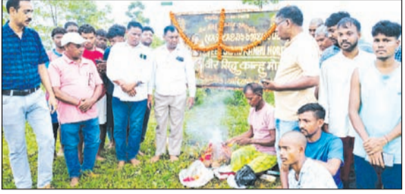
सिदो-कान्हू चौक पर श्रद्धांजलि अर्पित करते लोग

सतनपुर में श्रद्धांजलि सभा, जल-जंगल-जमीन व आदिवासी अखिला का लीया गया संकल्प