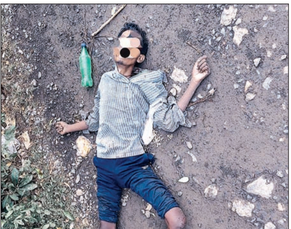
प्रत्युष नवबिहार संवाददाता

साहिबगंज : जिले के कोटालपोखर थाना क्षेत्र के स्टेशन जाने वाली पत्थर डिपो रोड पर रविवार सुबह एक अज्ञात व्यक्ति का शव मिलने से क्षेत्र में हड़कंप मच गया। सड़क किनारे शव पड़े