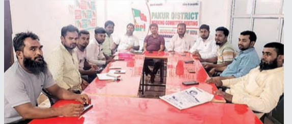
प्रत्युष नवबिहार संवाददाता