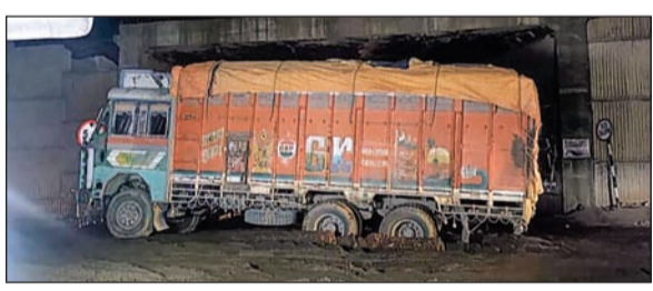
प्रत्युष नवबिहार संवाददाता

साहिबगंज : जिले के उधवा फोर लेन सड़क निर्माण के तहत उधवा चौक पर निर्माणाधीन ओवरब्रिज के कारण प्रत्येक दिन सड़क जाम की समस्या से लोगों को जूझना पड़ता है। वहीं ओवरब्रिज के नीचे उधवा-राजमहल रोड़ पर किचड़ और डस्ट में बड़ी वाहनों का फंसना रोजमर्रा बन गया है। जिसमें अधिकांश भारी वाहन फंसने से यातायात घंटों बाधित रहता है। बीते रात 10 बजे उधवा चौक ओवरब्रिज के नीचे एक गिट्टी लोडेड ट्रक संख्या बीआर 10