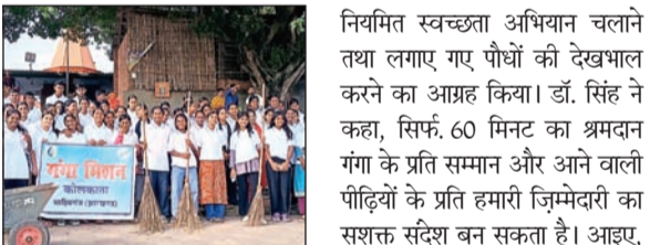
प्रत्युष नवबिहार संवाददाता

साहिबगंज : गंगा मिशन, कोलकाता के सौजन्य से तथा नगर परिषद (नगर पालिका), साहिबगंज के सहयोग से रविवार प्रातः मुक्तेश्वर धाम गंगा घाट पर विशेष गंगा स्वच्छता अभियान एवं श्रमदान कार्यक्रम का आयोजन किया गया। अभियान में शिक्षा केंद्र के छात्र-छात्राओं, शिक्षकों, नगर परिषद के कर्मियों, गंगा समिति के सदस्यों तथा स्थानीय नागरिकों ने उत्साहपूर्वक भाग लेते हुए गंगा घाट की साफ-सफाई की और स्वच्छता का संदेश दिया। कार्यक्रम के दौरान घाट परिसर से प्लास्टिक, पॉलीथिन एवं अन्य अपशिष्ट पदार्थों को एकत्रित कर उनका समुचित निस्तारण किया गया। सभी प्रतिभागियों ने प्लास्टिक मुक्त गंगा, स्वच्छ गंगा का संकल्प लिया तथा लोगों से गंगा तटों पर कचरा एवं प्लास्टिक नहीं फेंकने की अपील की।